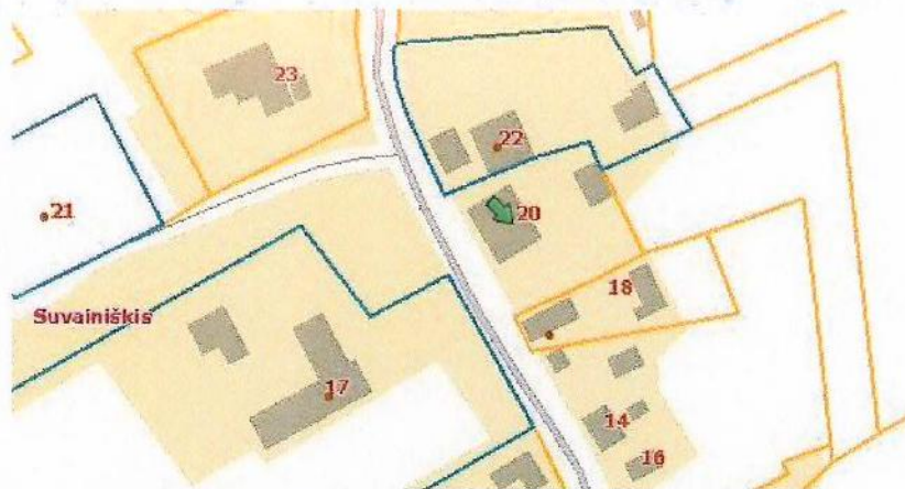
3 paveikslas. Planuojamo ir gretimų sklypų ribos

Informacinis skelbimas internetinėje erdvėje paskelbtas Rokiškio rajono savivaldybės administracijos internetiniame tinklalapyje adresu http://rokiskis.lt/lt/teritoriju-planavimas/detalieji-planai.html , Rokiškio rajono savivaldybės ribose platiname laikraštyje „Gimtasis Rokiškis“, pastatytas laikinasis informacinis stendas.