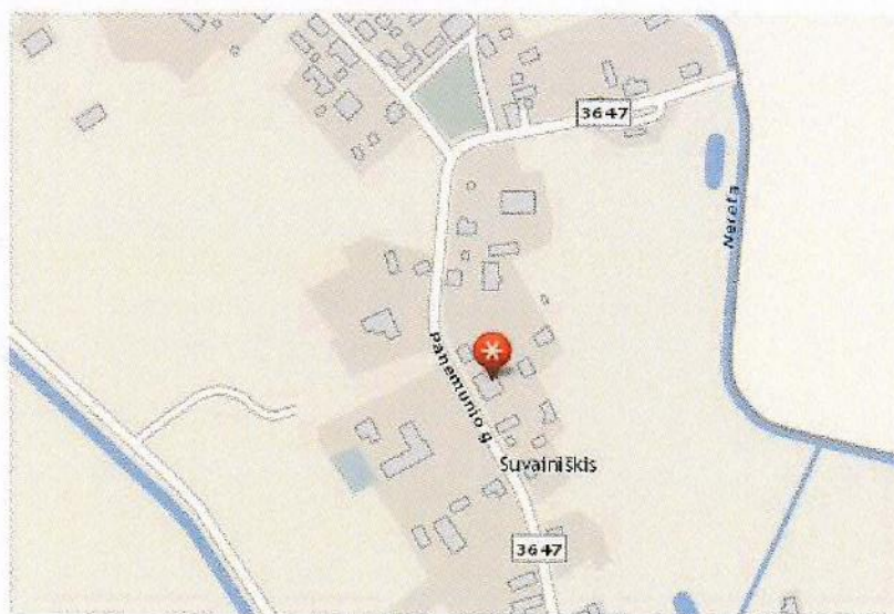
1 paveikslas. Planuojamos teritorijos padėtis vietovėje

1.3 PLANUOJAMA TERITORIJA: žemės sklypas, esantis Rokiškio rajono savivaldybėje, Pandėlio seniūnijoje, Suvainišio k., Panemunio g. 20 (žr. 1 pav.). Planuojamas plotas ~ 0,17 ha.